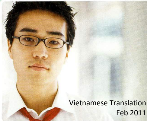
Vietnamese Translation Feb 2011

Thông tin này được cung cấp bởi Chương Trình San Francisco Hep B Free. Muốn biết thêm chi tiết, xin vào trang mạng SFhepBfree.org .